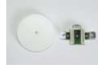
Dosenverteiler DV 5 DA, weiß* 100058125