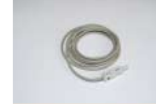
Prüf schnur für LSA-Plus-Leisten 100058222