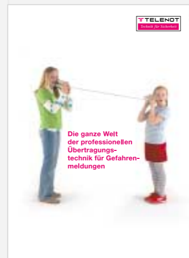
Prospekt „Übertragungstechnik für Gefahrenmeldungen“