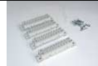
LSA-Plus 10 DA mit Befestigungsschrauben und Kabelbindern 100058219 (VE=4 St.)