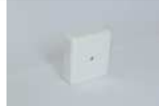
Verteiler VT 18-polig aP 100058130 weiß* 100058131 braun*