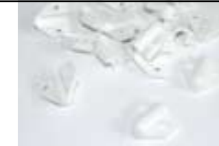
Befestigungskappen 10mm 100090092 weiß 100090091 braun 100090089 grau VE 20 St.