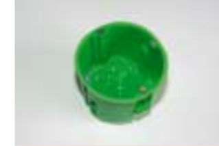
Hohlraumdose für Dosenverteiler* 100058122