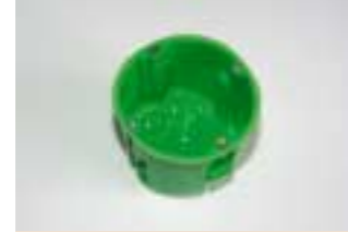
Hohlraumdose für Dosenverteiler* 100058122