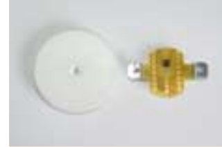
Dosenverteiler DV 19-polig, weiß* 100058120