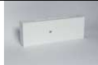
Verteiler VT 80-polig aP** 100058101 Verteiler VT 80-polig uP** 100058111 (ohne Abb.)