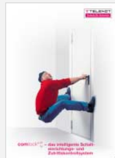
Prospekt „Zutrittskontrollsystem comlock“