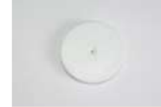
Deckel für Dosenverteiler* 100058123