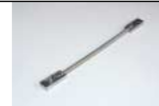
Kabelübergang für Fenster KÜ-180 100091646