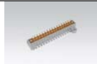
Lötleiste 16-polig 100058109