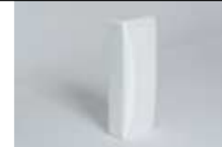
Verteiler VT2 8 DA aP 100058163 weiß* 100058165 braun*