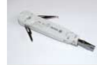
Montagewerkzeug für LSA-Plus Leisten 100058221