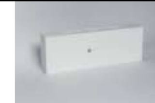
Verteiler Leergehäuse** VT 80-polig/60 DA aP: 100047041 uP: 100047044