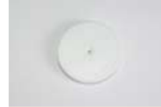
Deckel für Dosenverteiler* 100058123