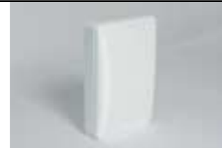
Verteiler VT2 32-polig aP 100058142 weiß* 100058144 braun*