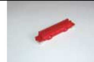
Schirmdrahtleiste 10 DA 100058224