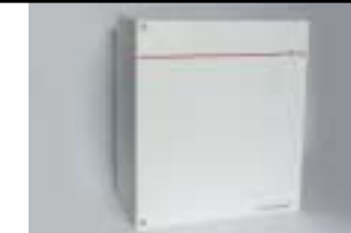
Verteiler Leergehäuse** VTZ 3 288-polig/180 DA im S10 100075185