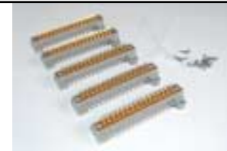
Lötleisten 16-polig mit Befestigungsschrauben und Kabelbindern 100058107 (VE=5 St.)