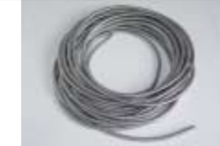
Metallschutzschlauch 10m 100090082 Alu natur innen 6/außen 8mm