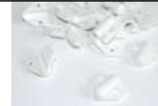
Befestigungskappen 9mm 100090081 weiß 100090087 braun 100090088 grau VE 20 St.