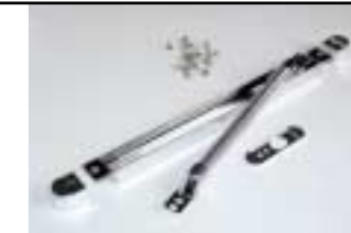
Verdeckter Kabel- übergang für Türen 100090351