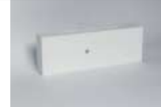
Verteiler VT 60 DA aP** 100058201 Verteiler VT 60 DA uP** 100058211 (ohne Abb.)