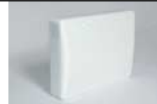
Verteiler VT2 64-polig aP 100058146 weiß* 100058147 braun*