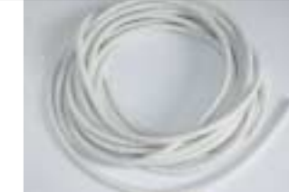
100090078 weiß 10m 100090077 braun 100090076 Alu natur innen 7/außen 10mm