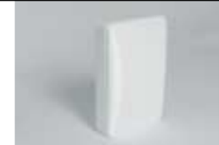
Verteiler VT2 16 DA aP 100058162 weiß* 100058164 braun*