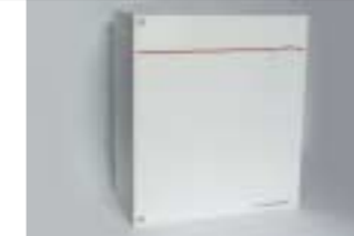
Verteiler** VTZ 3 180 DA im S10 100075187