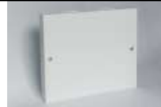
Verteiler VT 160-polig aP** 100058100 Verteiler VT 160-polig uP** 100058110 (ohne Abb.)