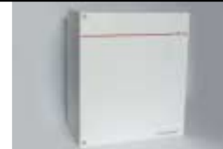
Verteiler** VTZ 3 288-polig aP im S10 100075186