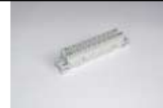
LSA-Plus-Leiste 10 DA 100058220