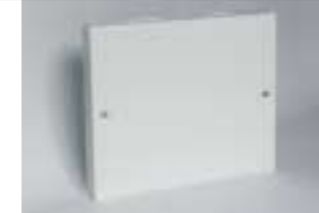
Verteiler VT 120 DA aP** 100058200