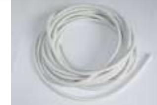
Metallschutzschlauch 10m 100090079 weiß 100090083 braun innen 6/außen 9mm