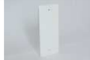
Verteiler VT 16-polig uP 100058113 weiß* 100058115 braun*