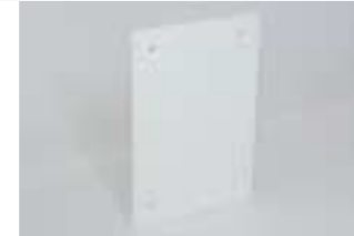
Verteiler VT 32-polig uP 100058112 weiß* 100058114 braun*