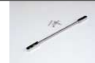
Miniatur Kabelübergang für Fenster 100091088