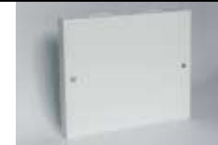
Verteiler Leergehäuse** VT 160-polig/120 DA aP: 100047040 uP: 100047043