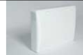
Verteiler VT2 32 DA aP 100058166 weiß* 100058167 braun*