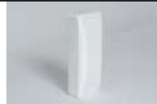
Verteiler VT2 16-polig aP 100058143 weiß* 100058145 braun*